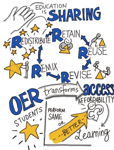
Abbildung: „OER is sharing“ von Giulia Forsythe. Diese Graphik ist unter der Lizenz CC 0 1.0 auf flickr veröffentlicht.

In diesem Workshop lernen Sie, was Open Educational Resources (OER) sind, wo sie OER finden und wie Sie diese in Ihrer Lehre einsetzen können. Im Workshop beschäftigen wir uns mit den Vorteilen von OER gegenüber anderen, urheberrechtlich geschützten Ressourcen, und lernen die „5V-Freiheiten“ von OER kennen. Ein weiterer Themenkomplex ist (offene) Creative-Commons-Lizenzen (kurz CC-Lizenzen), die für OER und ihren Einsatz in der Lehre eine zentrale Rolle spielen.